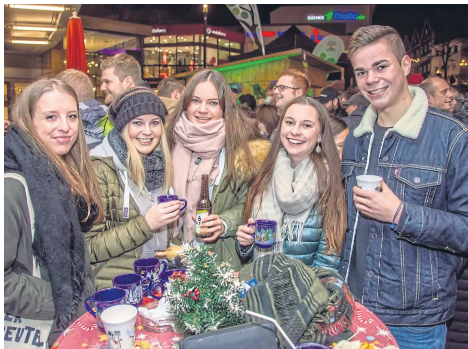
Der „Welcome Home Weihnachtsmarkt“ von Network Waldeck-Frankenberg in Korbach ist auch eine Art Sozialer Ort.

Es gibt aber natürlich noch viel mehr Soziale Orte in Waldeck-Frankenberg und ein kleiner Teil davon wurde auch entdeckt. Zum Beispiel der Schwimmbadverein Rengershausen ( www.freibad-rengershausen.de/unser-verein/ ), der 2007 die Schließung des lokalen Freibads verhindert hat. 130 eingetragene Mitglieder um einen 15-20-köpfigen „harten Kern“ wurden und werden immer noch