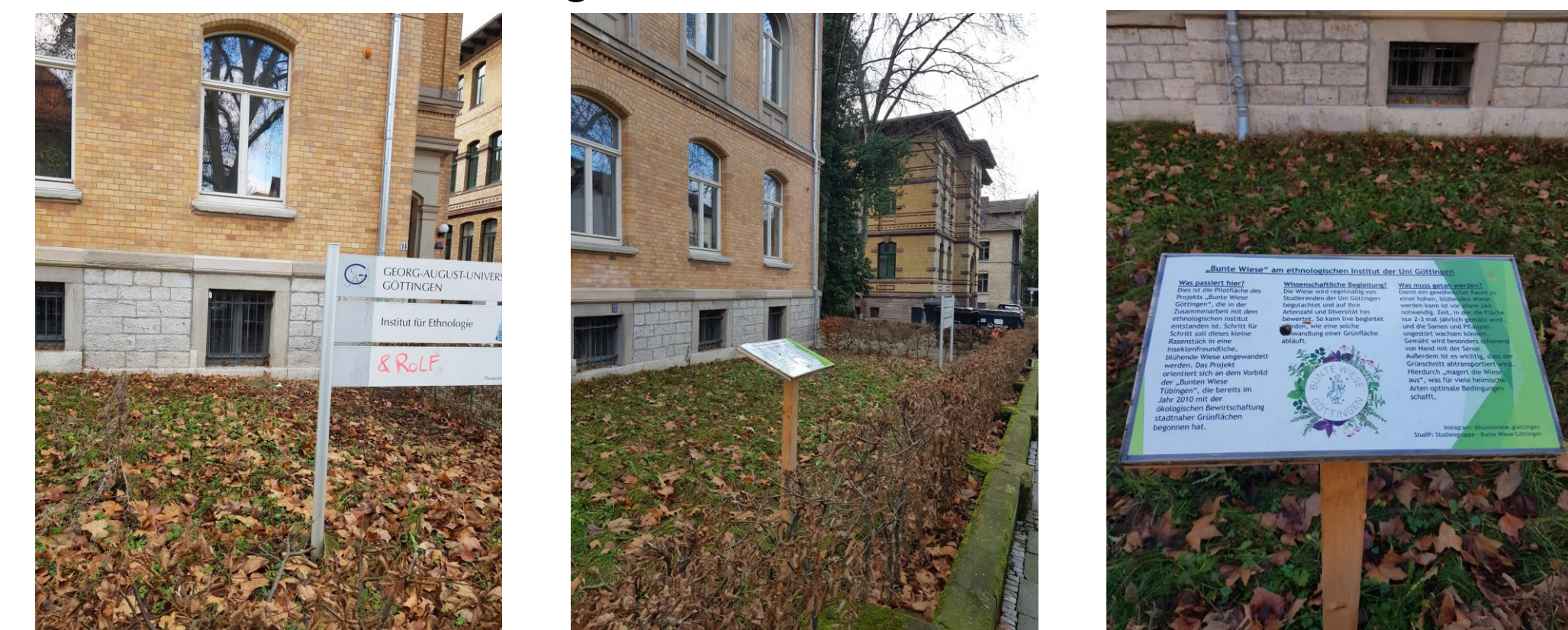
Die Grünfläche vor dem Institut der Ethnologie